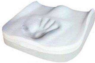
2 couches de mousse à mémoire