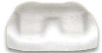
Forme du contour